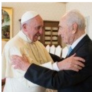
Francis & Peres

Peres at ang Papacy ay naganap. Ano ang sinabi sa oras na iyon ay magpapakita mismo ng, sa hindi bababa, ang espiritu ng panahon, at sa karamihan, isang malaking pagsulong patungo sa muling pagkabuhay ng papasyang pag-uusig.