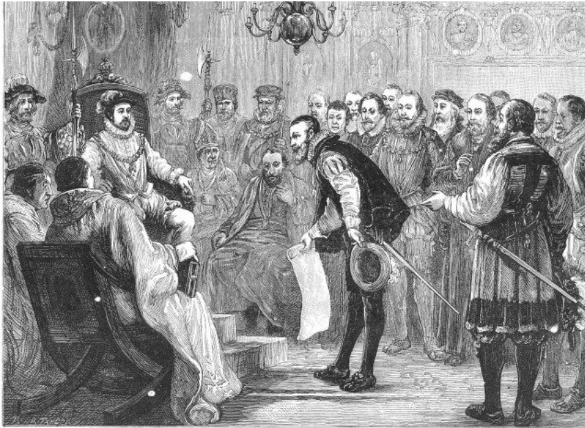
THE PROTESTANT PRINCES PRESENTING THEIR CONFESSION TO CHARLES.

kalayaan; at ang mga pinto ay nabuksan pa para sa pagsulong ng ebanghelyo. Gayunman mas mababa sa tatlong taon na ang lumipas, ito ay pinawalang-bisa, at ang Pope at ang Emperador ay hinihingi ang pagsumite sa ito ng simbahan / awtoridad ng estado. Ang mga prinsipe ay nakipagtulungan sa isa pang diyeta, at matatag na tumayo laban sa pangangailangan, pagtatalo ng budhi, at paglaban sa kalayaan sa relihiyon.